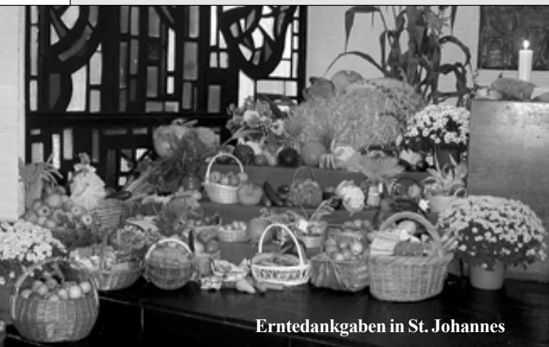
Erntedankgaben in St. Johannes

die Fülle. Es gibt keine Ruhe, außer im Dank. Dank macht den Menschen, überschreitet Zeit, anerkennt andere Zeit. Das stillt nicht das Verlangen, macht aber ruhiger. Mit jedem Dank wird offenbar, es gibt zwei Zeiten: Meine Zeit des Verlangens und Gottes Zeit des Gebens. Er gibt zu seiner Zeit, die die rechte ist. Das kann mich von Grund auf verändern, weil mein Verlangen die Richtung ändert, es zielt nicht mehr nur auf mich. Ich will die Fülle, ich verlange den Sinn. Ich kann ihn jedoch nicht selbst erlangen, sondern nur geschenkt bekommen. Dank sieht in meiner Zeit die Gotteszeit. Verlangen sucht alles, Dank sieht, was schon da ist. Verlangen sucht Gott in der Ferne, Dank sieht ihn nah. Damit sind schon Aspekte der Dankadresse angesprochen. Unausgesprochen steht hinter jedem Wort zum Thema Dank die christliche Überzeugung, dass der Mensch nicht(s) sich selbst verdankt, sondern alles Gott zu danken hat. Das schmälert in keiner Weise menschliche Anstrengungen, Fertigkeiten und Leistungen, sondern erinnert an den Urheber all unserer guten und weniger guten Möglichkeiten. Wir säen und ernten in den verschiedenen Bereichen unseres Lebens. „Es geht durch unsere Hände, aber es kommt von Gott.“ Wir sind Umformer, keine kleinen Schöpfer. Solche Einsichten können meines Er-