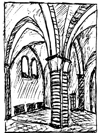
Südvorhalle des Ratzeburger Doms